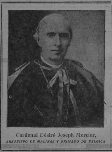
Cardenal Désiré Joseph Mercier, ARZOBISPO DE MALINAS Y PRIMADO DE BELGICA.

tro luminoso, donde todas las ciencias filosóficas (Instituto Superior de Filosofía), que él quisiera buscar sus primeros principios. Fue entonces al Abate Mercier a quien los Obispos de Bélgica encargaron de realizar este vasto plan. León XIII lo llamó a Roma y le pidió que le indicara un